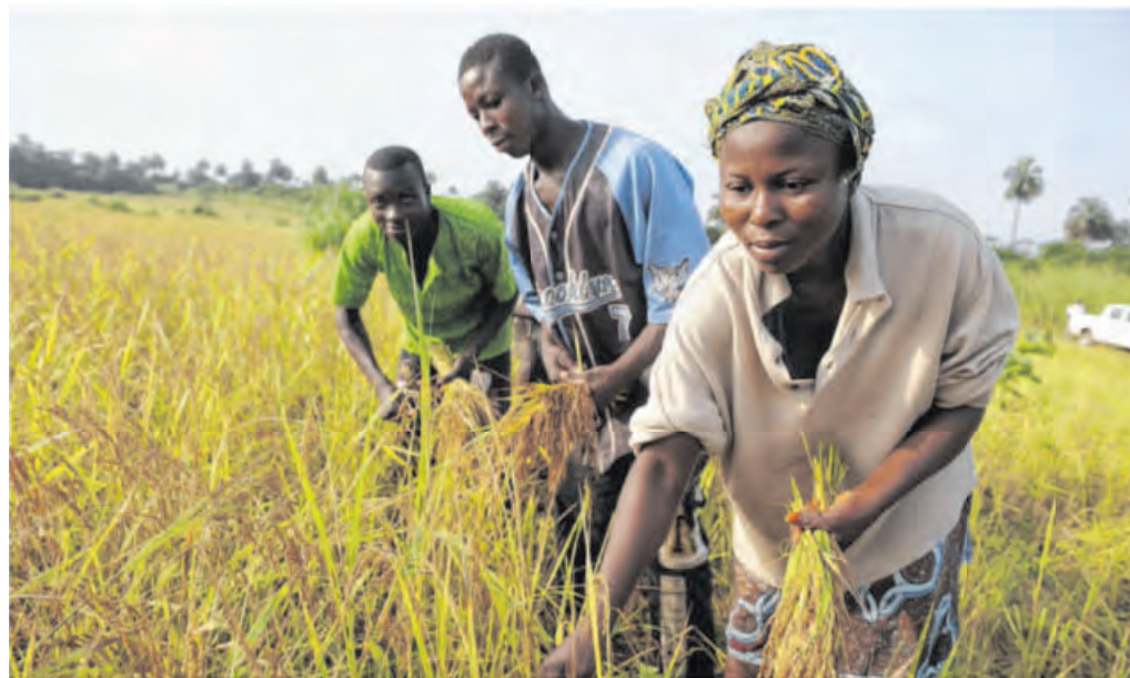
Eine Familie in Afrika erntet Reis. Gerade die Existenz von Kleinbauern und damit die Ernährung der ländlichen Bevölkerung ist bedroht, wenn große fruchtbare und gut zugängliche Flächen an ausländische Konzerne verkauft werden. Archivfoto

Die Veranstaltungen, die zu einem Großteil im Haller Neubau stattfinden, können von allen In-